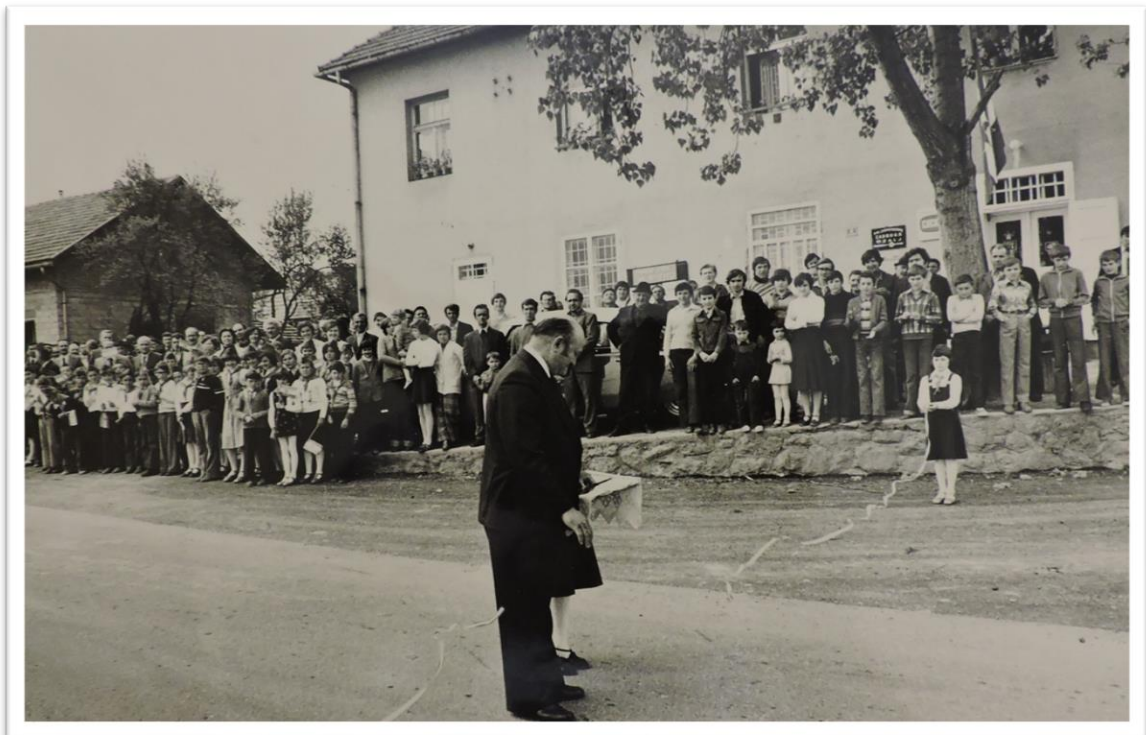
Učenci s učiteljicom i mještanima 1973. godine otvaranje vodovoda