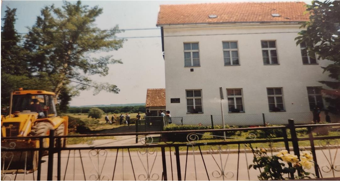
Početak gradnje igrališta ljeto, 2003. godine