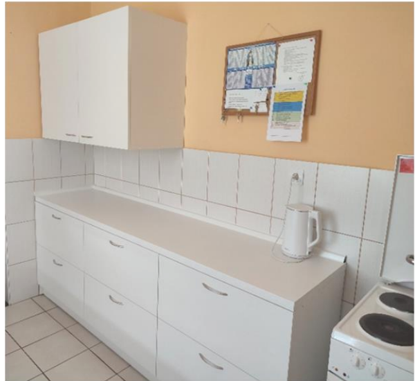
Kuhinja u novom ruhu šk. god. 2021./2022.