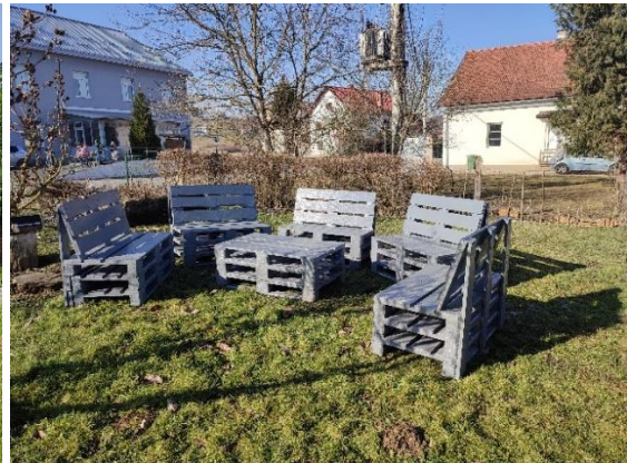
Učionica na otvorenom šk. god. 2023./24.