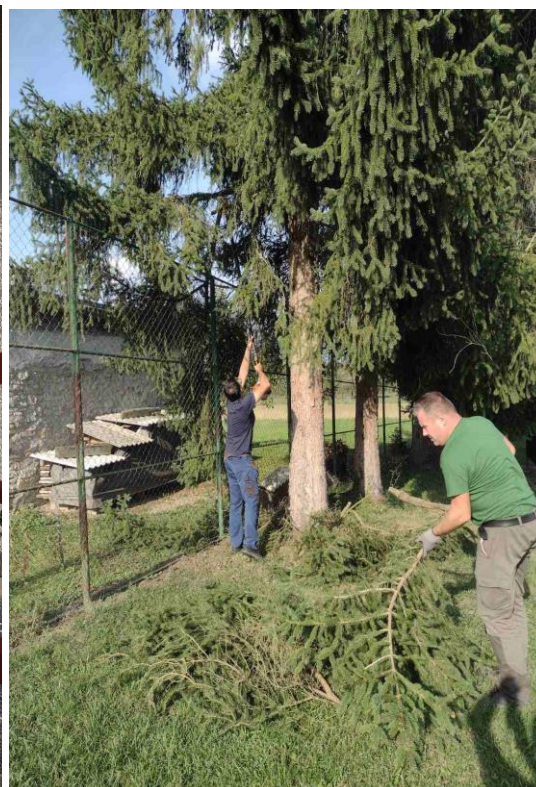
Akcija Hrvatska volontira, u akciju su se uključili roditelji i mještani uređenjem školskog okoliša, uređenje školskog igrališta te ličenje ograde škole, šk. god. 2021./2022.