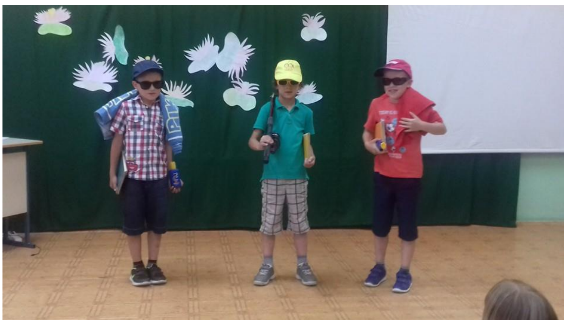
Dramska i recitatorska skupina