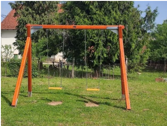
Projekt "Zemlja i ja" 2022./2023. Crveni križ Ozalj