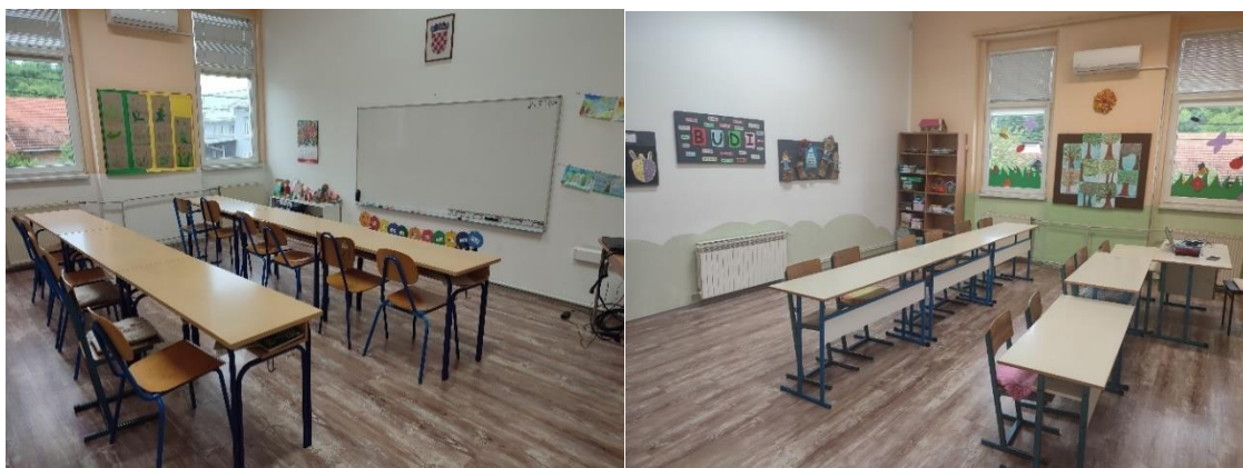
Velika učionica na katu pregrađena i prenamijenjena u dvije manje učionice, šk. god. 2020./2021.