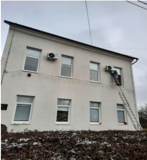
Postavljanje klima uređaja šk. god. 2021./2022.