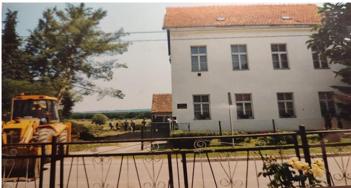
Početak gradnje igrališta ljeto, 2003. godine