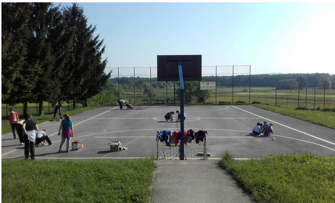
Građanska akcija DND-a Ozalj "I nama treba igralište“, šk. god. 2016./2017.