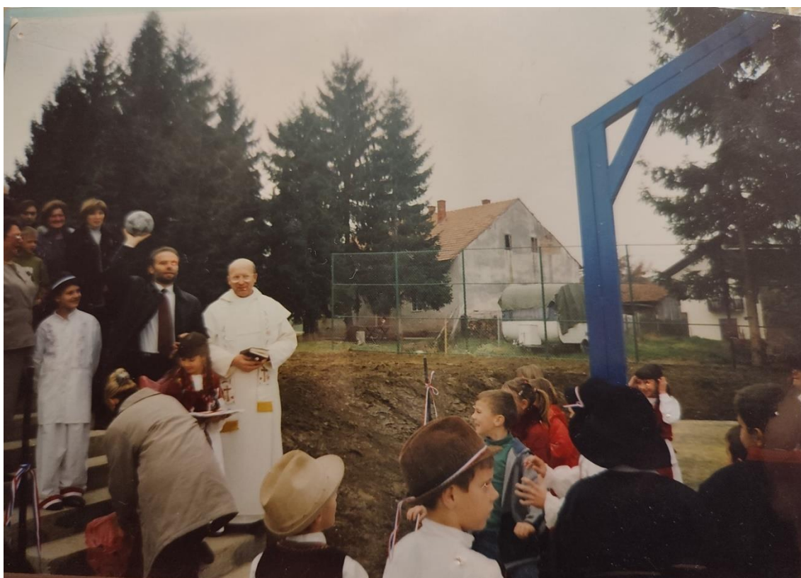
Otvorenje igrališta 14. studenog 2003.