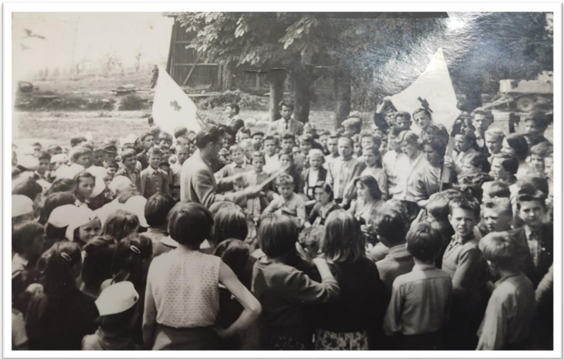
Učenici iz PŠ Mali Erjavec sudjeluju u proslavi Tjedna crvenog križa 12. svibnja 1961.