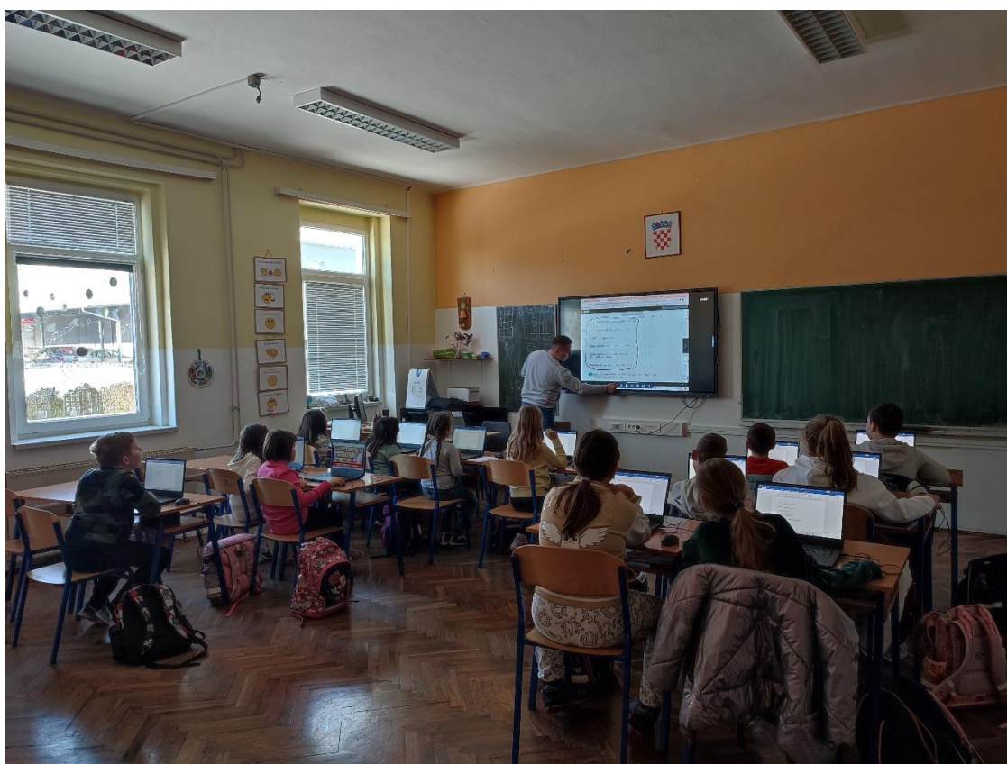
Učionica 21. stoljeća (pametna ploča i računala – sat Informatike), šk. god. 2023./24.